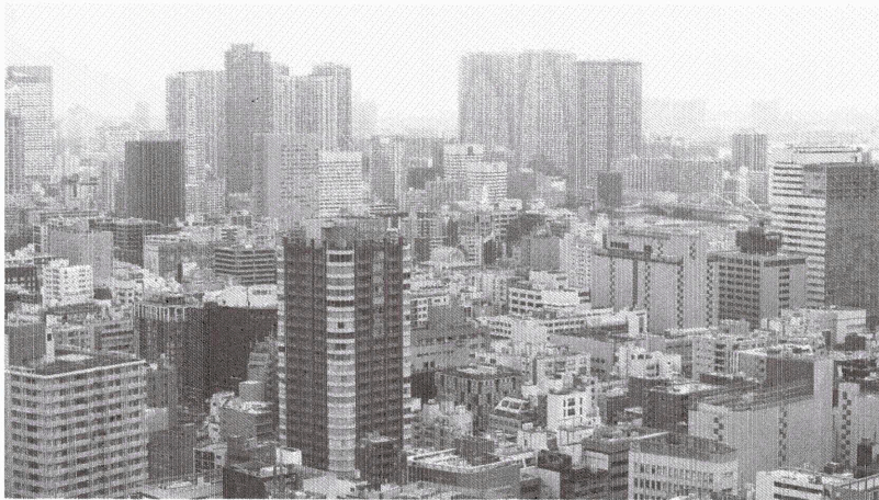
ネットキャッシュのマイナスが大きい上場企業をランキングしました

1月13日に配信した「最新！これが『金持ち企業』トップ500社だ」には、多くの反響が寄せられた。